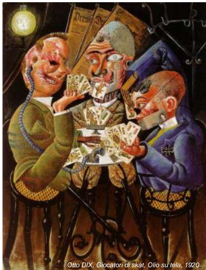
Otto DIX, Giocatori di skat, Olio su tela, 1920

Seguite le indicazioni per Caorle, fino a giungere ad una rotatoria; qui seguite le indicazioni per Trieste (NON per Caorle). Attraversati i paesi di S. Giorgio di Livenza e La Salute di Livenza, ad una nuova rotatoria voltate a destra. Dopo circa 2 Km troverete l'indicazione del centro abitato di Ottava Presa; sulla sinistra vi è una strada con l'indicazione "Marango". Percorsa questa strada per 2 km troverete, superato il ponte sul fiume Lemene, il monastero.